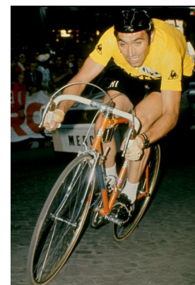
Merckx på jakt

Om 60-talet hörde till Anquetil så var belgaren Eddy "kannibalen" Merckx kungen av 70-talet. Första segern kom 1969 och sedan hann Merckx med 3 segrar till (70-72) innan Luis Ocaná (ESP) stack mellan med en vinst. Merckx hade därmed tangerat rekordet på 4 segrar i rad och när han återigen vann 1974 var han även i kapp Anquetil med totalt fem segrar. Ytterligare en stor mästare skulle slå igenom under 70-talet. Bernard Hinault (FRA) vann Tour de France två år i rad 1978-79 och mer skulle komma senare. Andra viktiga händelser under decennier var införandet av bergstävlingen med den rödprickiga bergströjan och tävlingen för bästa unga cyklist med den vita ledartröjan 1975. Dessutom hölls den första prologen i form av ett tempolopp 1976.