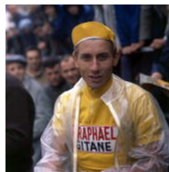
Anquetil först till fem

Den tidigare nämnde Jacques Anquetil har sin storhetstid i början av 60-talet. Mellan 1961 och 1964 vinner han Tour de France fyra gånger i rad och blir även den förste någonsin att nå fem totalsegrar. Anquetils stora styrka var tempoloppen och fram till en viss Miguel Indurain gjorde entré på 90-talet var han ohotad som den bästa tempocyklisten i Tour de Frances historia. Under 60-talet drabbades Touren också av en av sina största tragedier då britten Tom Simpson dog av överansträngning på Mont Ventoux efter att ha tagit amfetamin. Något som gjorde att dopningstester infördes året efter. Innan 60-talet var slut hade den andre store cyklisten i Tour de Frances historia presenterat sig. Eddy Merckx vann för första gången 1969. Under 60-talet deltog även en svensk cyklist för första gången, Göran "Ökenkungen" Karlsson, som körde Tour de France 1960.